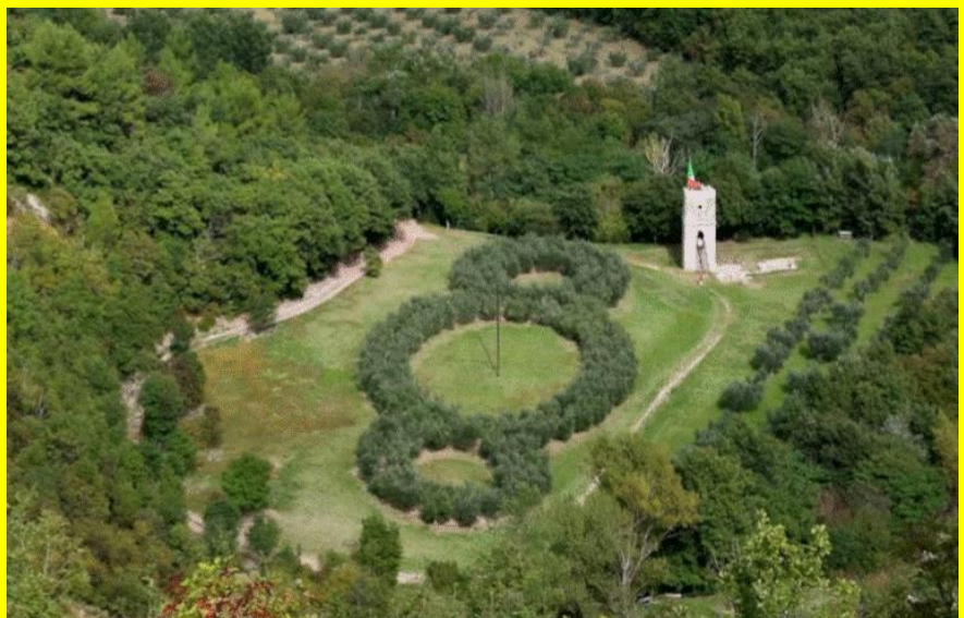
(Il Terzo Paradiso nel Bosco di San Francesco ad Assisi)